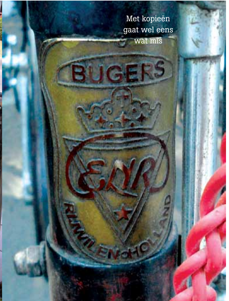
Met kopieën gaat wel eens wat mis